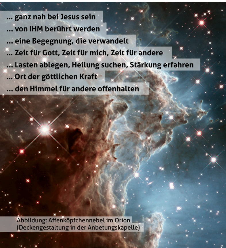
Abbildung: Affenköpfchennebel im Orion (Deckengestaltung in der Anbetungskapelle)

Als Hausgast im Bonifatiuskloster besteht die Möglichkeit, während der Nacht Anbetung zu halten.